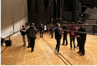
大道具の仕掛け仕込み！

朗読を担当した参加者の皆さんは、ワークショップ当日に台本を渡されたとは思えない“名演”で作品に花を添えて下さいました。