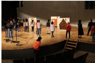
大道具の出来上がり！