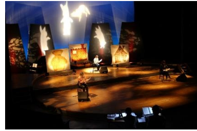
照明で登場する動物たちの形を表現！