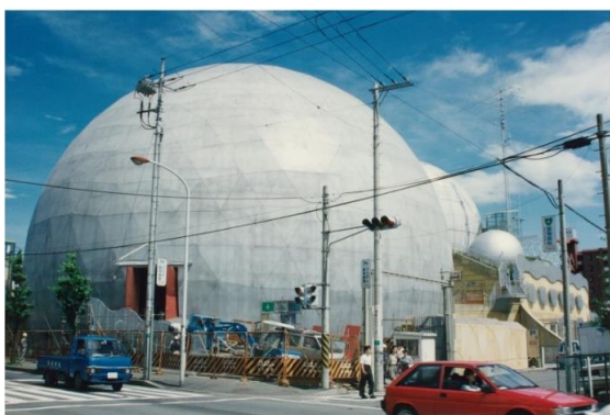
市民シアター外観完成直後