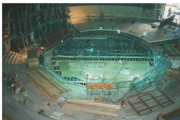
市民シアターのホール内を撮影