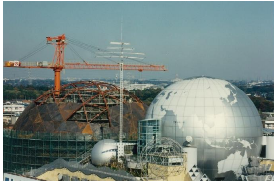
建設途中の市民シアター