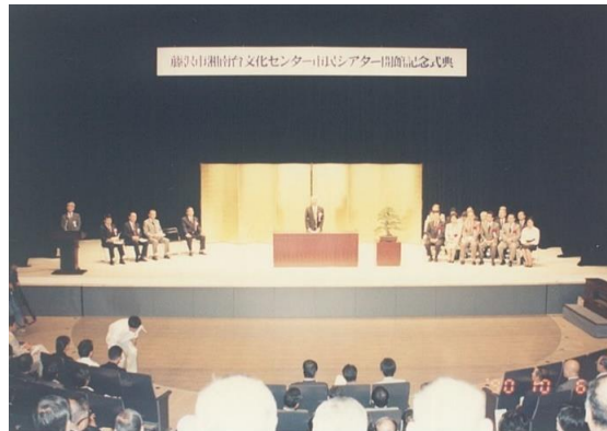
開館記念式典の様子