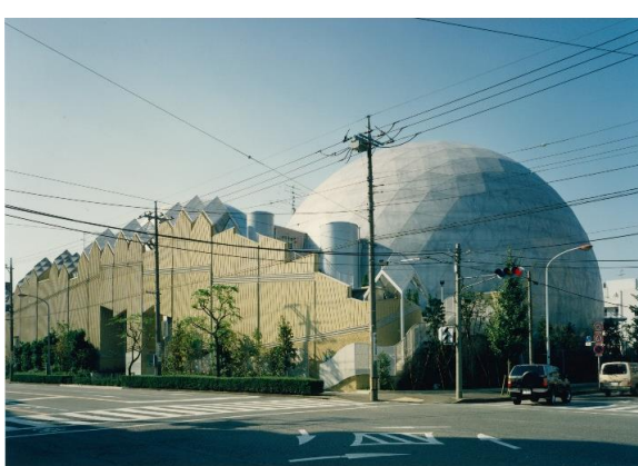
市民シアター完成当時の外観