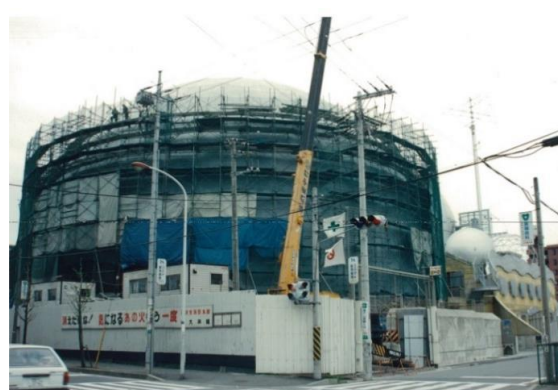
市民シアター建設中の光景