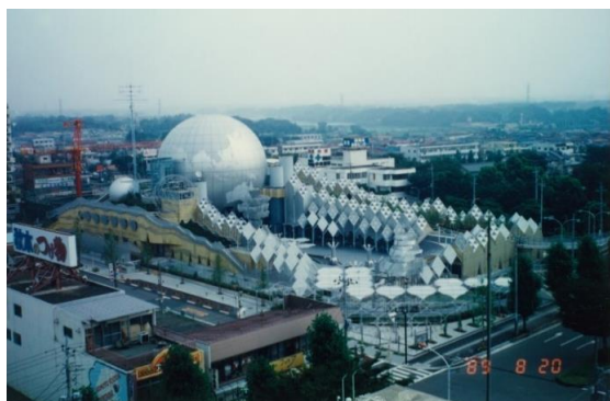
建設開始当初の市民シアター

今後も、市民の皆さまや利用者さまに愛される施設として頑張っていきたいと思っております。